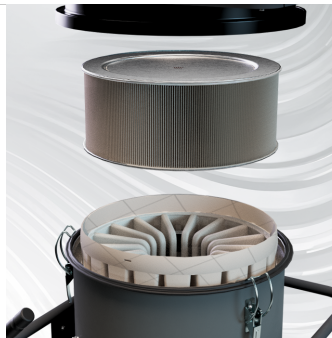
PULIZIA FILTRO Filtro in poliestere + HEPA (opzionale)