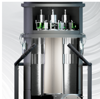
PULIZIA FILTRO Filtro a 3 cartucce alluminizzato + HEPA (opzionale)