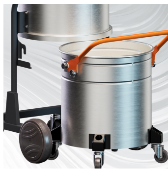
RACCOLTA Sistema di raccolta da 50lt