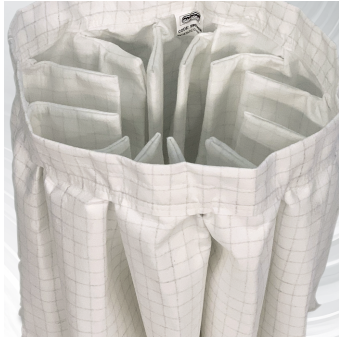
FILTRAZIONE Filtro primario in poliestere