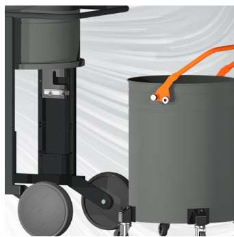
SVUOTAMENTO Sistema di raccolta da 75 lt