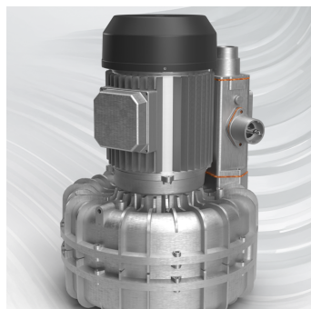
ENGINE Turbina 7,5 KW