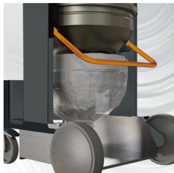
INTERCAMBIABILITA' Con sacco continuo Longopack