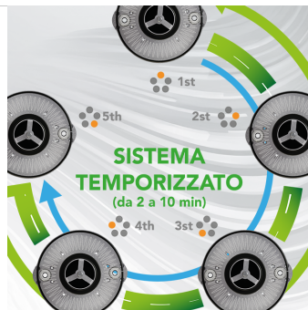
SISTEMA DI PULIZIA Sistema di pulizia brevettato ICLEAN