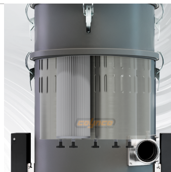
FILTRAZIONE 5 filtri a cartuccia HEPA + PTFE conduttivi