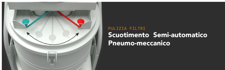
PULIZIA FILTRI Scuotimento Semi-automatico Pneumo-meccanico