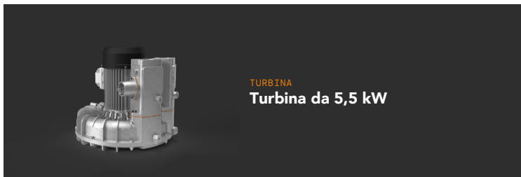
TURBINA Turbina da 5,5 kW