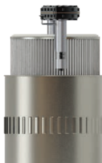
CARTUCCE IDRO-OLEOFOBICHE Cartuccia classe M idro-oleofobica