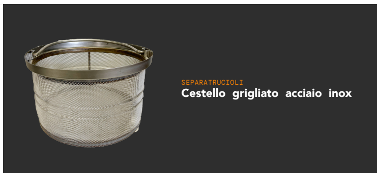
SEPARATRUCIOLI Cestello grigliato acciaio inox