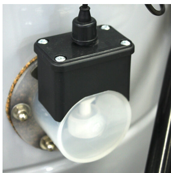
GALLEGGIANTE ELETTRICO OIL 80 2M Galleggiante elettrico connessione magnetica